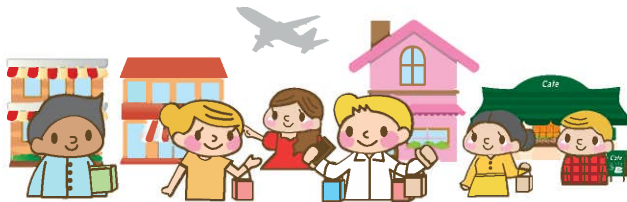
訪日外国人旅行者1人あたりの買物代（国籍・地域別）