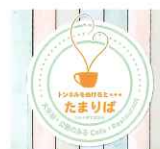
トンネルをぬけると...たまりば