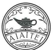
カレー工房 あいあい亭