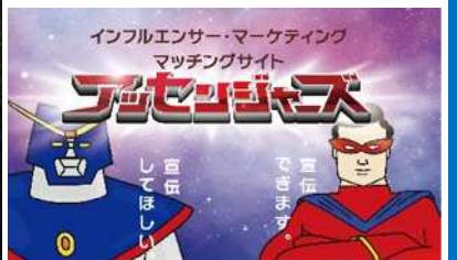
「アッセンジャーズ」サイトイメージ