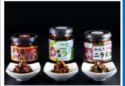
開発したニラ醤油