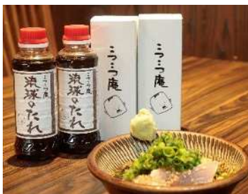
好評販売中「琉球のたれ」