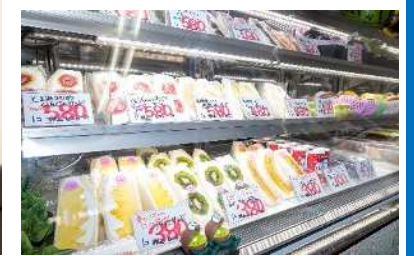
開発したくだものさんど