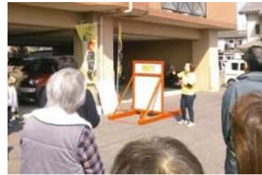
オモシロ消防訓練風景