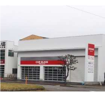
社屋 (整備工場) 風景