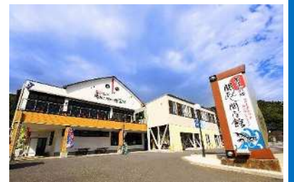
佐賀関の関あじ関さば館